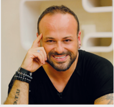
ARET VARTANYAN YAZAR

Yaklaşımını, kitapları ve seminerleri ile milyonlarca insanla buluşturan yazar ve Yaşam Atölyesi kurucu ortağı Aret Vartanyan, başlattığı toplumsal projeler ve yarattığı kitlesel iletişim kanalları ile çalışmalarını son dönemde uluslararası platforma da taşıdı.